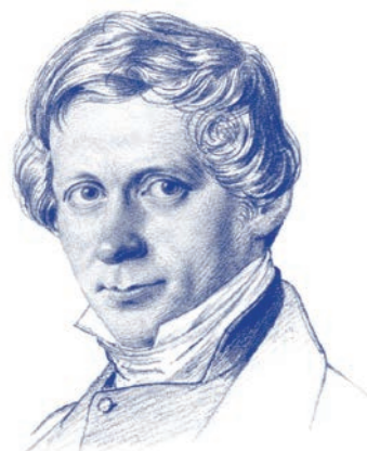
Das Gebot der Nächstenliebe muss sich im sozialen Engagement zeigen. Johann Hinrich Wichern (1808–1881)

Quelle: Diakonisches Werk der Evangelisch-lutherischen Kirche in Bayern e.V. (Hg.): Anders Sein. Bausteine für Unterrichtspraxis in der Realschule und im Gymnasium. H6