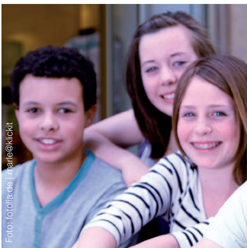
Gemeinschaft verwirklichen – die Vision der Diakonie.

Jesus entfaltet das bereits alttestamentlich begründete Gebot der Nächstenliebe in mehrfacher Hinsicht. Wohnungslos ohne soziale Absicherung, wendet sich der Gottessohn selbst leidenden Menschen zu: Er heilt Kranke, gibt Hungernden zu essen, begibt sich ausdrücklich in Gemeinschaft mit sozial ausgegrenzten Menschen. Immer wieder ruft er seine Zuhörerschaft auf, sich selbst nach dem Gebot der Nächstenliebe zu verhalten. Das Gleichnis vom „barmherzigen Samariter“ (Lukas 10,25–37) betont, dass allein die jeweilige Notlage bestimmt, was im Sinne Jesu zu tun ist. Weder ethnische noch kulturelle oder religiöse Grenzen dürfen von der Hilfeleistung abhalten. Im 19. Jahrhundert begründeten unter anderem Theodor und Friederike Fliedner, Johann Hinrich Wichern und Wilhelm Löhe die moderne Diakonie. Eine Rede des Hamburger Wichern (1808–1881) auf dem Kirchentag in Wittenberg 1884 gilt als Initialzündung. Hier betonte Wichern, dass sich das Gebot der Nächstenliebe im sozialen Engagement zeigen muss.