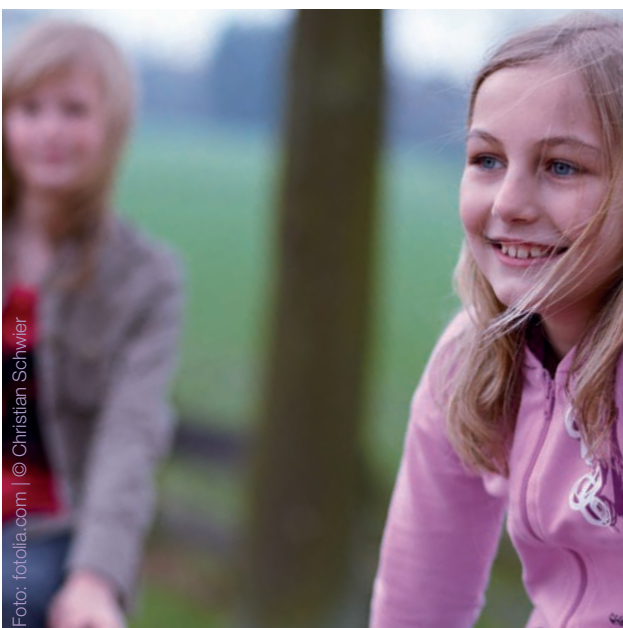
Jeder braucht mal Hilfe. Gut, wenn dann Freunde da sind.